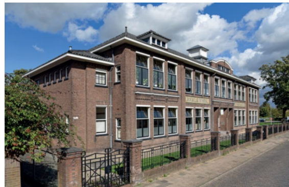
Locatie Tiel, Jacob Cremerstraat

De zes scholen van Stichting Oosterwijs zijn de Sterrenkijker Oss en Uden, de Sonnewijser route vervolgonderwijs Oss en Tiel en de Sonnewijser route arbeid Oss en Tiel. Kijk op https://www.oosterwijs.nl voor meer informatie.